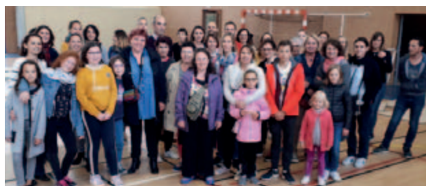
► Une quarantaine de personnes se sont mobilisées pour l'aide au rangement le dimanche, en fin de braderie

Encore un grand merci aux nombreux bénévoles qui ont aidé de près ou de loin à l'organisation, à l'installation, au rangement, à veiller à la sécurité à l'entrée des salles, aux bénévoles qui ont tenu le stand restauration, et à ceux qui ont préparé de délicieux gâteaux. Sans vous, la braderie n'aurait pu avoir lieu. Rendez-vous le dimanche 31 mars 2019 pour la 5 ème édition.