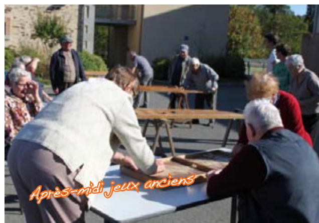
Après-midi jeux anciens

Dans le cadre du Festival des aînés, vingt randonneurs ont découvert des chemins communaux de Domloup. Parmi eux, certaines personnes ont formulé leur souhait de poursuivre cette découverte et cette activité de marche en groupe. Si vous pratiquez régulièrement la marche, vous désirez la faire en compagnie, contacter la mairie, qui vous mettra en relation avec d'autres marcheurs.