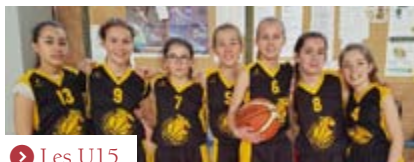
➤ Les U15

Certaines catégories ont besoin d'être renforcées en joueurs. Parlez-en autour de vous, allez jouer avec eux !