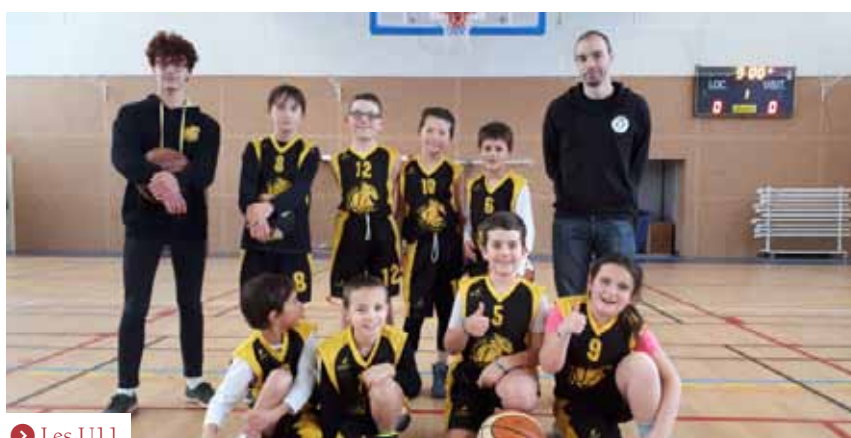
➤ Les U11

Les U11 (2008-09) s'entraînent le mercredi. Les contenus deviennent plus techniques et les entraîneurs encore plus exigeants pour peaufiner les bases qui se doivent solides pour les années futures. Les poussins sont encadrés par Evan, Alexandre, Aleksandr, Lou et Nicolas.