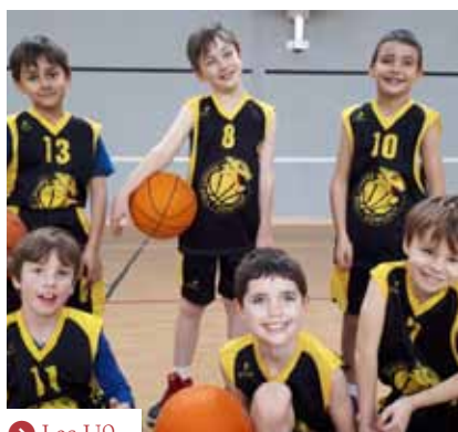
➤ Les U9