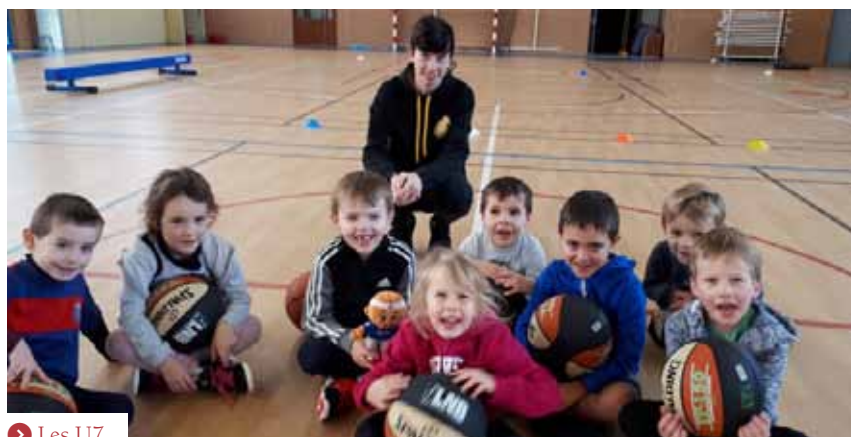
➤ Les U7