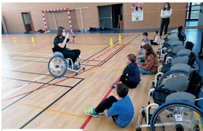
Association handisport 35