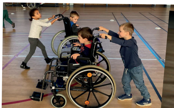
Les plus jeunes ont également participé aux initiations handisports

Ces vidéos sont disponibles sur le site web de la mairie : https://www.domloup.fr/category/sports/