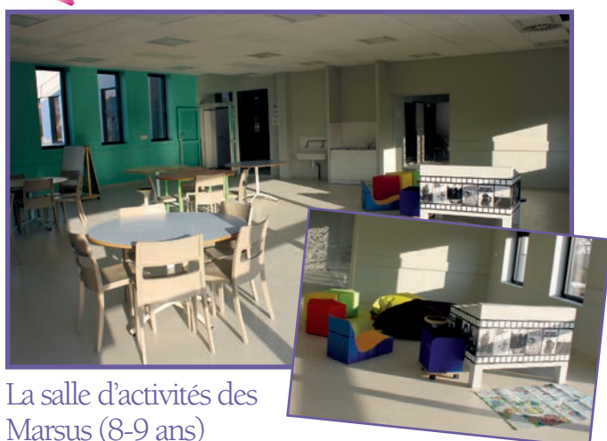
La salle d'activités des Marsus (8-9 ans)