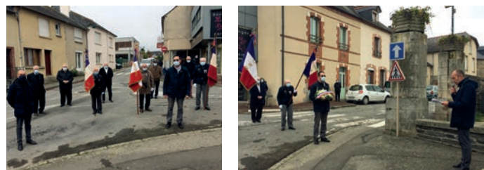
Une cérémonie emplie d'émotion.

Mercredi 11 novembre, une délégation d'élus et de membres des anciens combattants se réunissait pour commémorer la fin de la première guerre mondiale.