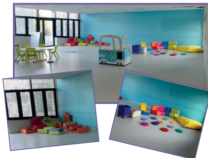
La salle d'activités des Schtroumpfs (3-4 ans)