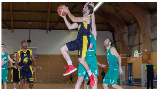
Domloup toujours plus haut.

Reprise des matchs amicaux pour l'équipe U13 et les deux équipes U11.