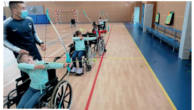
Initiation au tir à l'arc