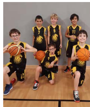
Equipe U11 1ère année.

Reprise des matchs amicaux pour l'équipe U13 et les deux équipes U11.