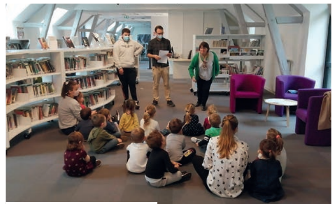
Initiation à la langue des signes