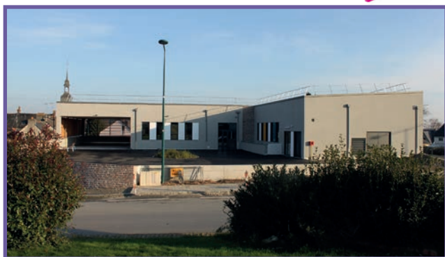
Une vue d'ensemble du pôle enfance