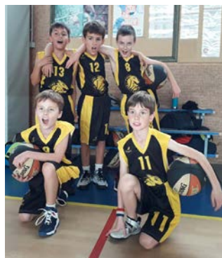
Equipe U11 2ème année..