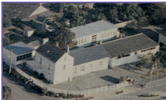
L'ancienne école aujourd'hui disparue