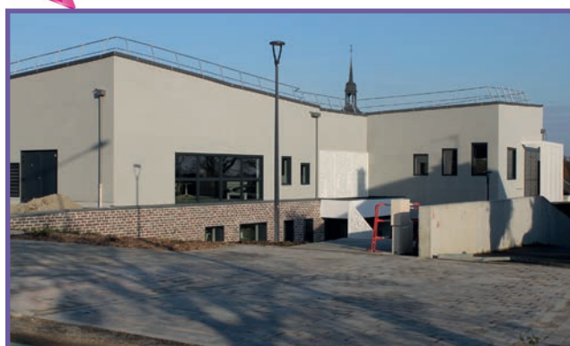
Le parvis entièrement piétonnier pour sécuriser les déplacements des enfants