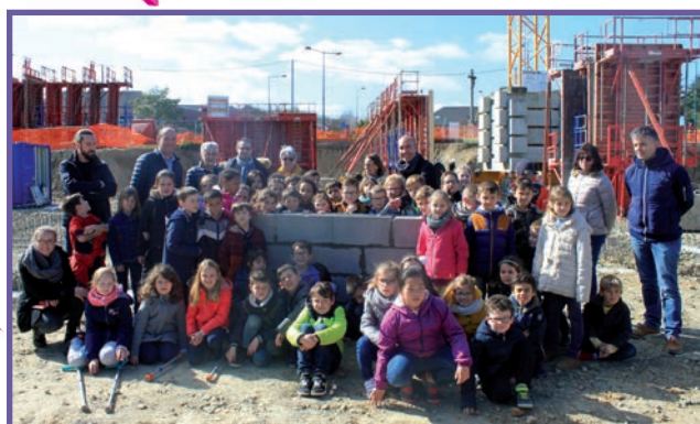
La pose de la première pierre