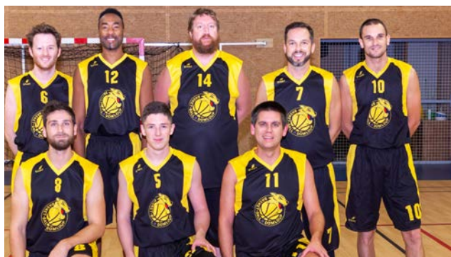
Equipe Senior pour le match de coupe.

Reprise du championnat pour les Seniors et qualification en coupes 35 avec une nette victoire 71 à 53 contre Chartres de Bretagne.