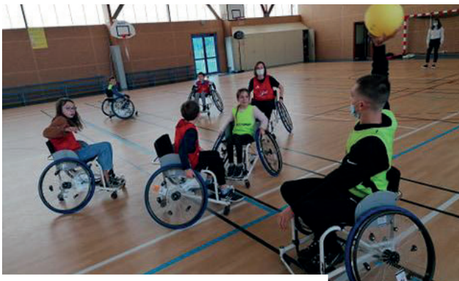
Les Scoobys lors d'une initiation basket fauteuil.

Une pièce de théâtre en langue des signes a également été proposée par la compagnie 10 doigts pour l'ensemble des groupes.