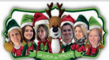
Vous souhaitez d'excellentes fêtes de fin d'année