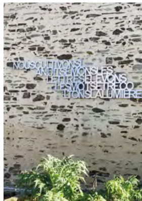
«Nous cultivons la nuit, semons les lettres, élevons les mots et récoltons la lumière.»

L'alliage, artisanat et patrimoine, tel est l'objet souhaité pour symboliser la culture domloupéenne faisant écho à l'empreinte artistique du territoire communautaire.