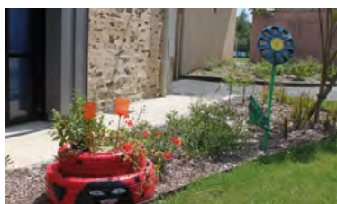
Atelier de récupération pour décorer l'espace public

Jean-Jacques Gardan propose par ailleurs régulièrement des projets pédagogiques avec les enfants de l'accueil de loisirs.