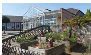
Atelier semis de tomates, citrouilles, courgettes