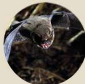
PIPISTRELLE COMMUNE

En juin, le GRETIA a continué ses inventaires sur les Araignées et les Coléoptères carabiques sur certaines prairies et a débuté les inventaires sur les Coléoptères saproxylophages dans les haies. Bretagne vivante a continué ses inventaires sur la Botanique et a débuté l'inventaire acoustique initial des populations de chiroptères sur la commune.